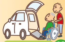
通いサービス 定員18名